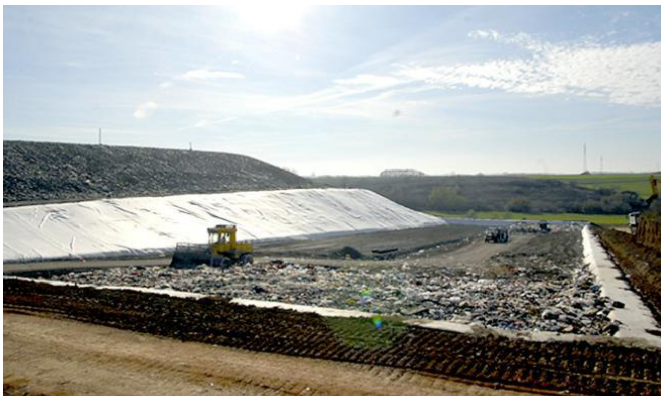
Slika 2.4 Odlagalište otpada Vitika